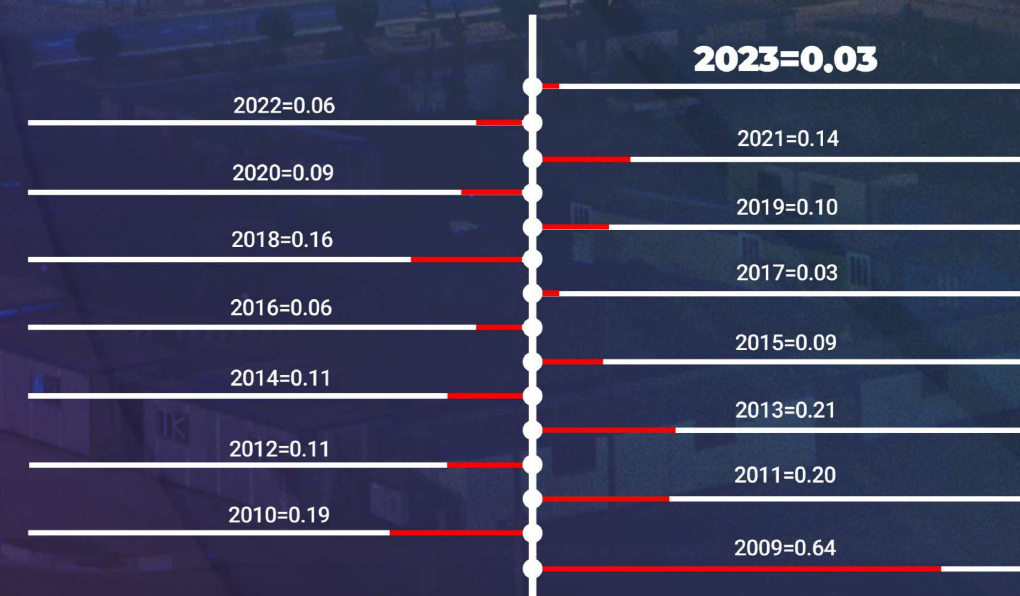
Arya Sasol Polymer Company Recordable Case Rate

نرخ شاخص RCR برای آریاساسول در پایان ماه May سال میلادی جاری (۱۴۰۲/۰۳/۱۱) برای سومین بار در طول مدت گزارش این شاخص از سال ۲۰۰۹ تاکنون، بعد از ماه های ژوئیه ۲۰۱۸ و سپتامبر ۲۰۲۰ مجدداً به میزان ۰/۰۳ معادل بایک حادثه قابل ثبت در ۱۲ ماه گذشته رسیده است.