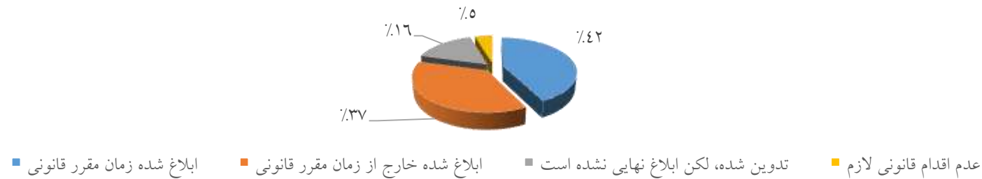
نمودار (۱) درصد تحقق مقررات قوانین مورد بررسی